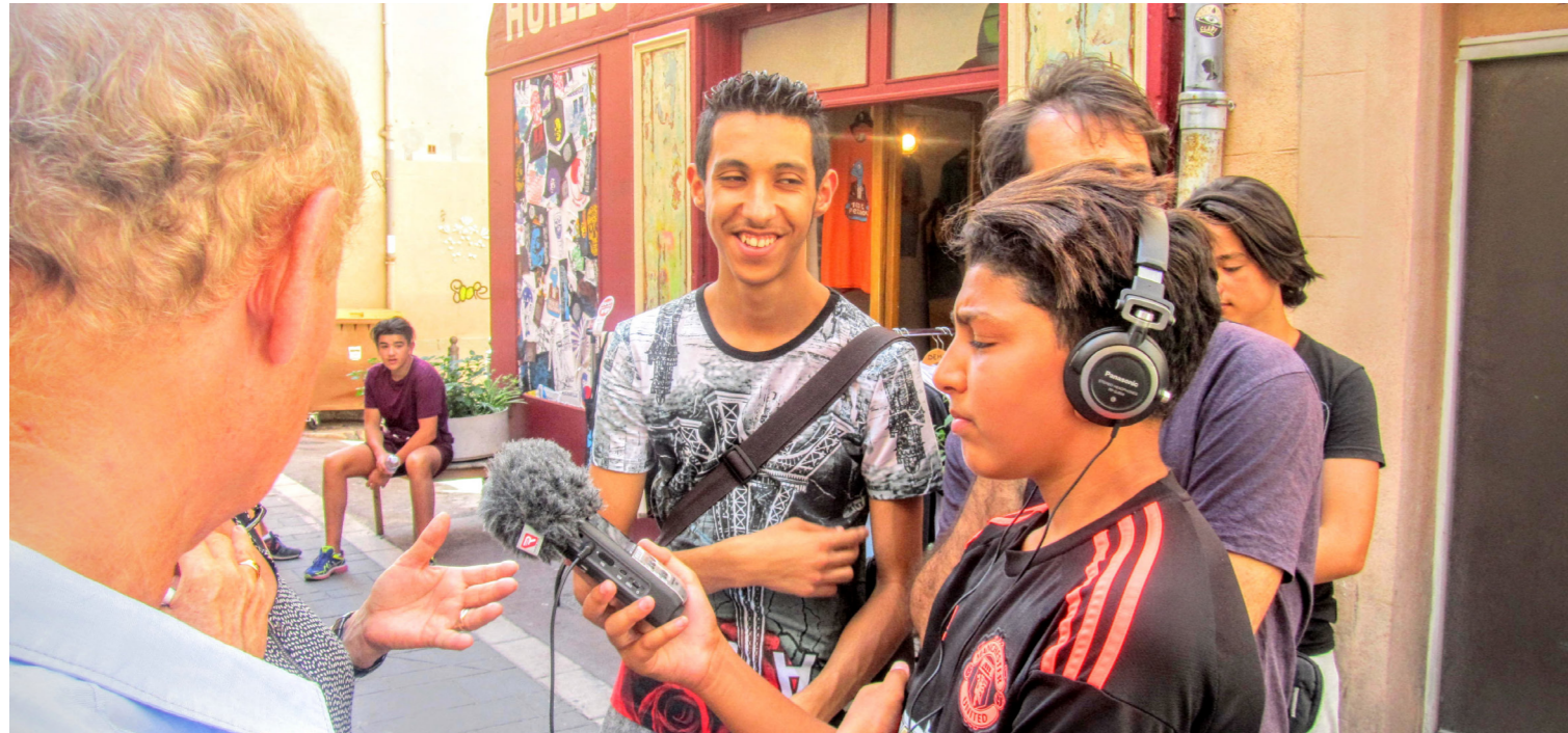
Hors Série N°1 Juillet 2016

Il y a tout à inventer avec les jeunes, mais il faut qu'on arrive à faire les projets ensemble et qu'on mette la barre haut !